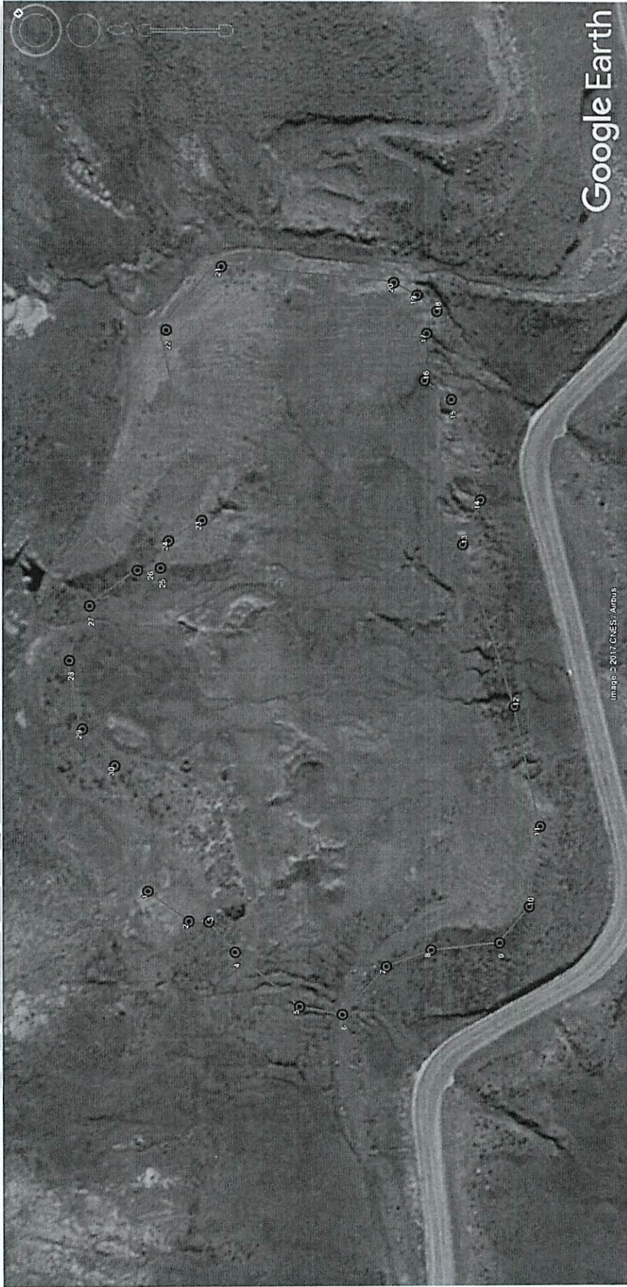
Imagen Satelital N°01 DME Km 191+300 L.I.